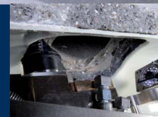
ZULÄUFE ÖFFNEN IM SCHLAUCHLINER STAHLANKER ABTRENNEN

IN KOMBINATION MIT KA-TE SPACHTELROBOTERN UND -VERSCHALUNGSTECHNIK KÖNNEN SO EINE VIELZAHL AUCH KOMPLEXER SCHADENSBLDER BEARBEITET WERDEN. DAS EINSATZSPEKTRUM UMFASST DIE REPARATUR VON RISSEN, SCHERBENBILDUNGEN MIT EINRAGENDEN KANTEN, AUSBRÜCHEN, SCHADHAFTEN MUFFEN UND ZULÄUFEN BIS HIN ZU FEHLENDEN WANDUNGSTEILEN.